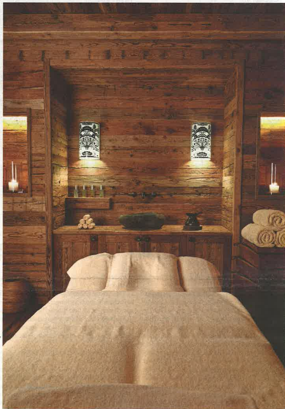
Kategoriesieger im Spa-Ranking: «Alpina Gstaad».

Ein Gesamtkunstwerk des Wohlbefindens ist das Grand Hotel Kronenhof (9) in Pontresina. Die 166-jährigen Mauern und die subtil renovierten Interieurs strahlen eine Gelassenheit aus, die man anderswo vergeblich sucht.